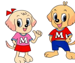
モモちゃん モトくん