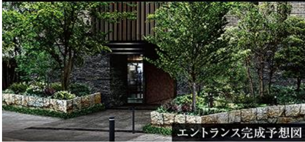
エントランス完成予想図