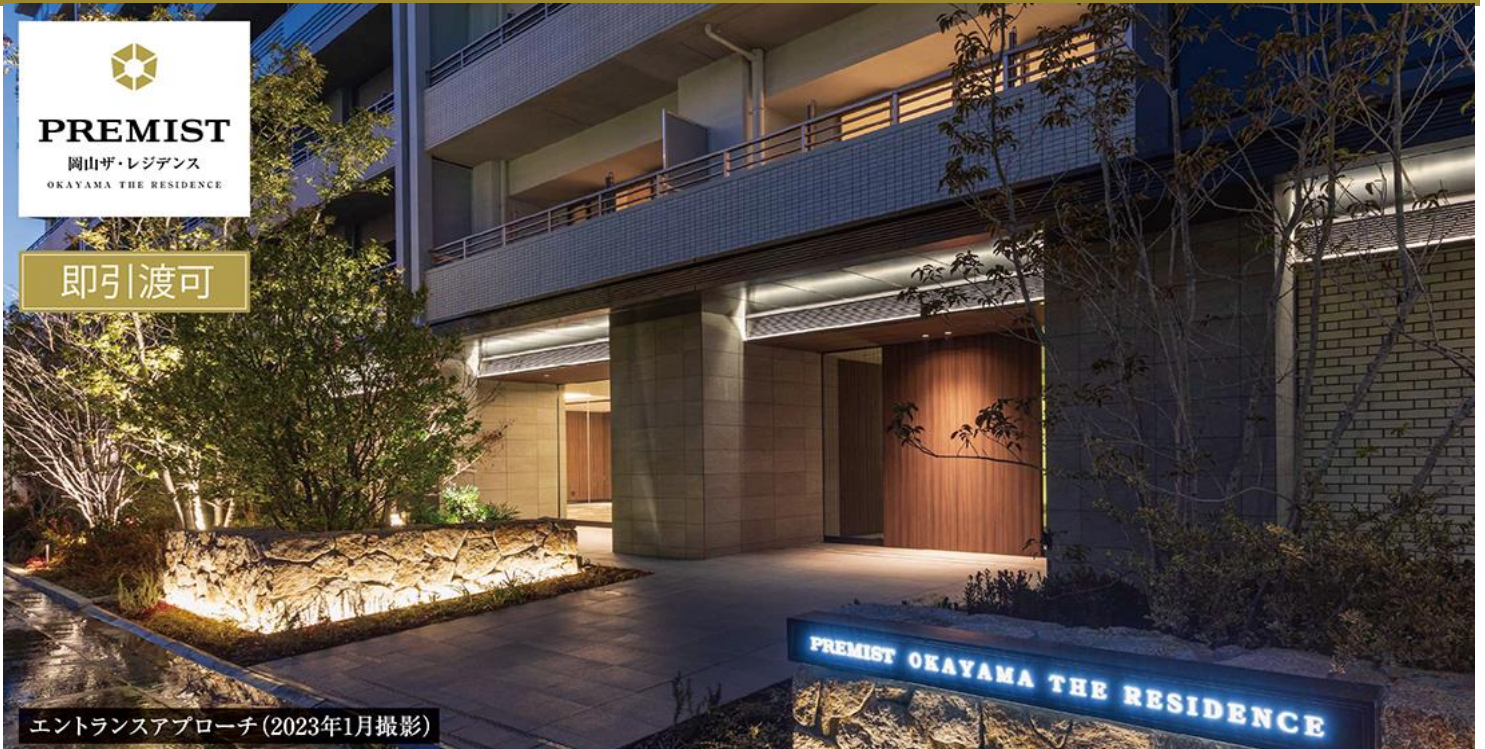
エントランスアプローチ (2023年1月撮影)

JFEグループ及び関連会社の皆様には、 分譲価格(税込)より 0.5% の提携法人割引がございます