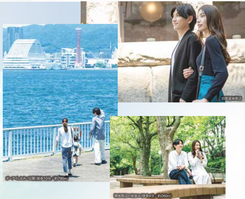
ポアイしおさい公園(徒歩10分 約790m)

きらめく海、爽やかな風、聴こえる潮騒。 わたしたち家族にぴったりの、KOBEがやっと見つかった。 何かと忙しい朝も、残業で疲れた夜も、この街にいますべてが特別になる。 ここで暮らし始めてから、子どもたちがよく笑うようになった。 なんでもない一瞬も、かけがえのない時間に思えるようになった。 総167邸の駅前タワーレジデンス 「ワコーレ神戸P.I.TOWER RESIDENCE」。 都心のすぐそばに、こんなにも家族を愛せる住処があったなんて。