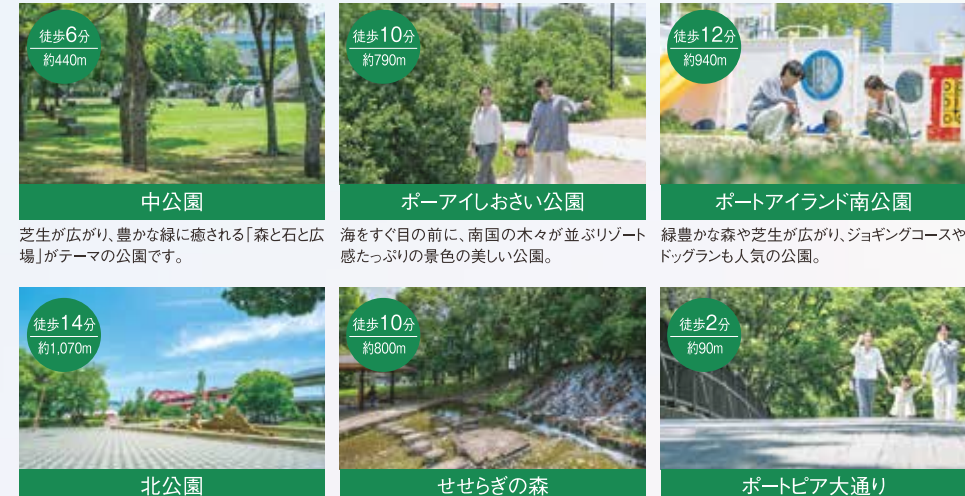
芝生が広がり、豊かな緑に癒される「森と石と広場」がテーマの公園です。