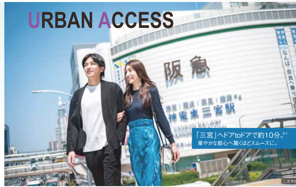
「三宮」へドアtoドアで約10分。 華やかな都心へ驚くほどスムーズに。