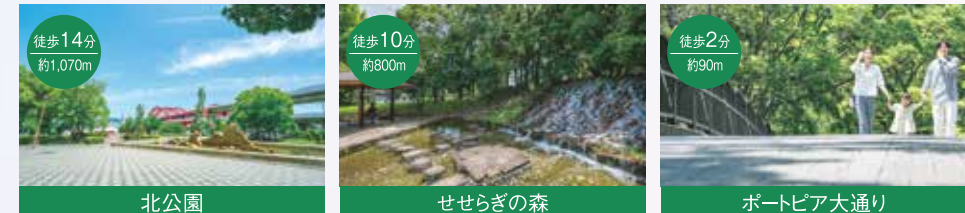
神戸大橋のたもとにあり、六甲山系を遠景に神戸の街並みを一望できます。