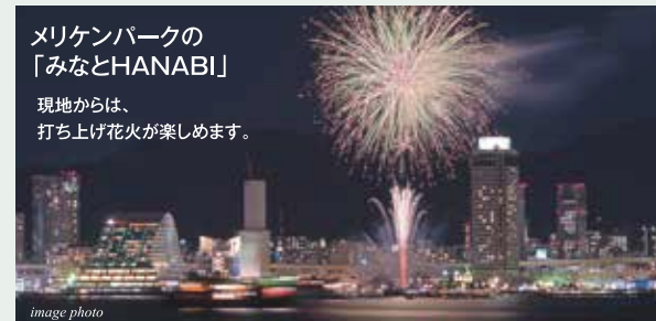
メリケンパークの「みなとHANABI」 現地からは、打ち上げ花火が楽しめます。

「みなとHANABI」は、10月の5日間にわたってメリケンパーク沖から打ち上げられ神戸の夜を彩る分散型の花火イベント。開催期間中はいつでも気軽に楽しめる人気です。