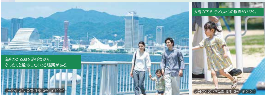
海をわたる風を浴びながら、ゆったりと散歩したくなる場所がある。