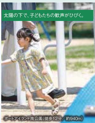
太陽の下で、子どもたちの歓声がひびく。