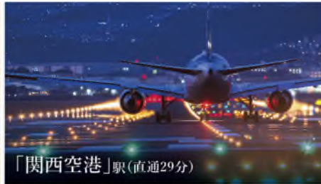
「関西空港」駅(直通29分)