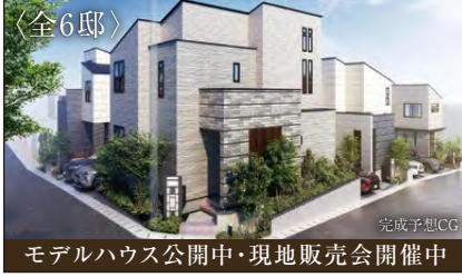
モデルハウス公開中・現地販売会開催中