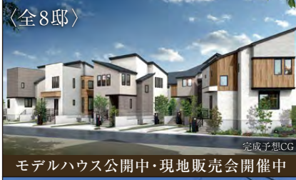
モデルハウス公開中・現地販売会開催中