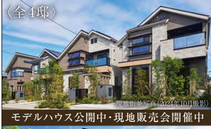
モデルハウス公開中・現地販売会開催中