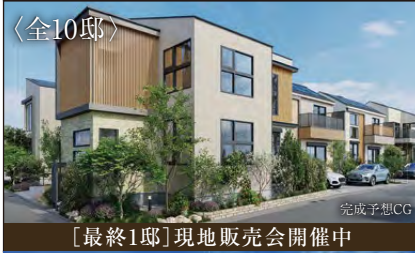
[最終1邸] 現地販売会開催中