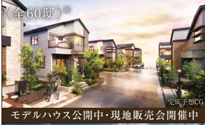
モデルハウス公開中・現地販売会開催中