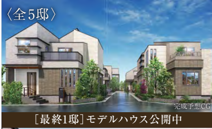
[最終1邸] モデルハウス公開中