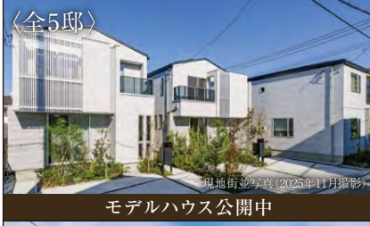
モデルハウス公開中