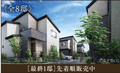
[最終1邸] 先着順販売中