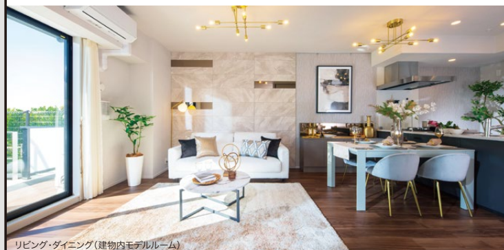
リビング・ダイニング(建物内モデルルーム)