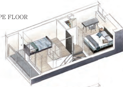
● SCAPE FLOOR

立体的に広がる住空間をライフスタイルに合わせて使い分けられるメゾネットプラン。上下階の音が気になりにくく、フロアごとのPP (Public・Private) 分離で家族間のプライバシーも尊重できます。