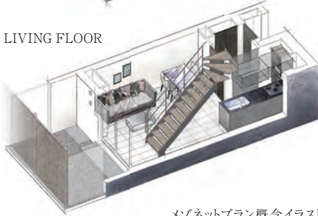
● LIVING FLOOR