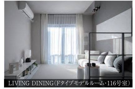
LIVING DINING (Fタイプモデルルーム・116号室)