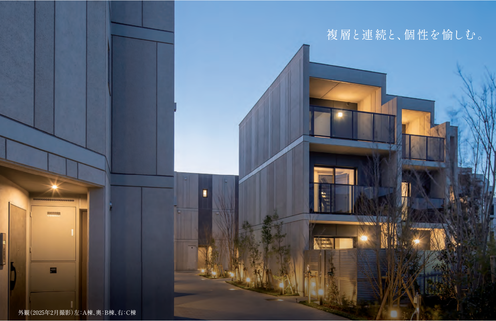
外観 (2025年2月撮影) 左:A棟、奥:B棟、右:C棟