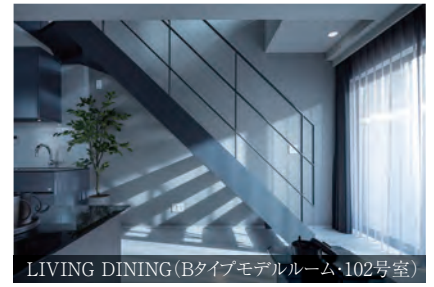
LIVING DINING (Bタイプモデルルーム・102号室)