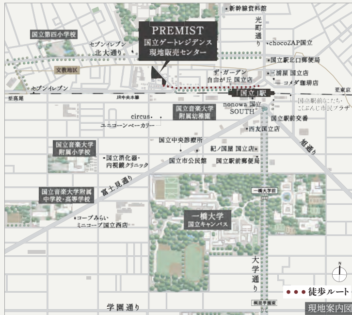
●●● 徒歩ルート 現地案内図

※掲載の現地周辺航空写真は、2024年6月に撮影した空撮にCG加工を施したものです。 ※大学通り徒歩8分、一橋大学 国立キャンパス徒歩13分 ※徒歩分数表示については80mを1分として算出(端数切り上げ)したものです。