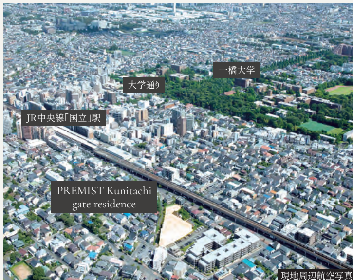
現地周辺航空写真

※掲載の現地周辺航空写真は、2024年6月に撮影した空撮にCG加工を施したものです。 ※大学通り徒歩8分、一橋大学 国立キャンパス徒歩13分 ※徒歩分数表示については80mを1分として算出(端数切り上げ)したものです。