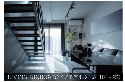
LIVING DINING (Bタイプモデルルーム・102号室)