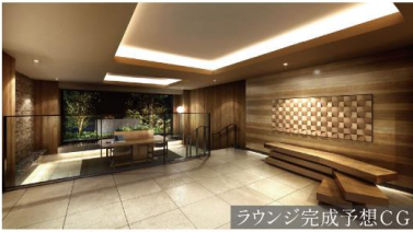
ラウンジ完成予想CG