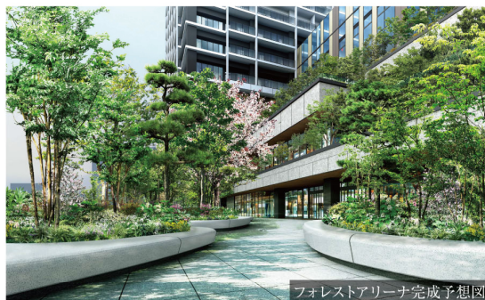
フォレストアリーナ完成予想図