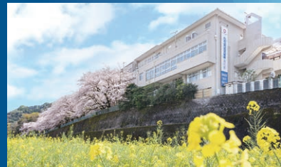
ネオ・サミット 湯河原