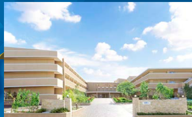
ネオ・サミット 茅ヶ崎