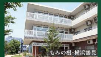
もみの樹・横浜鶴見