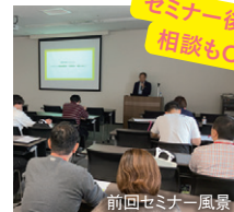
前回セミナー風景