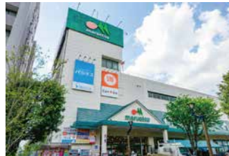
マルエツ瀬谷店 徒歩8分 (No.3~9)、徒歩9分 (No.1~2)