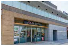
イオンスタイル横浜瀬谷 徒歩11分 (No.3~9)、徒歩12分 (No.1~2)