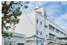
瀬谷小学校 (通学校) 徒歩5分 (No.7~9)、徒歩6分 (No.1~6・8) ※通学路