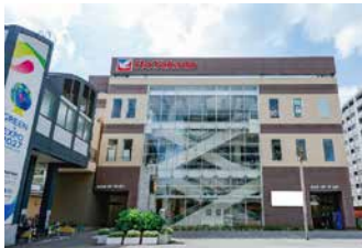
イトヨーカドー食品館瀬谷店 徒歩9分 (No.7~9)、徒歩10分 (No.1~6)