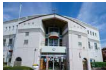
瀬谷愛児園 徒歩4分 (No.5・7~9)、徒歩5分 (No.1~4・6)