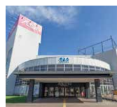
そよら 湘南茅ヶ崎