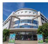
イオン 茅ヶ崎中央店