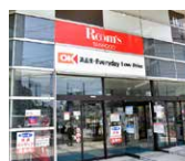
オーケー あざみ野店