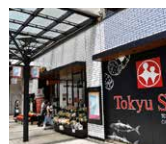
東急ストア あざみ野店