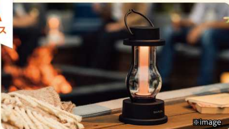
BALMUDA The Lantern (黒)