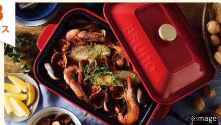
BRUNO コンパクトホットプレート鍋セット (赤)