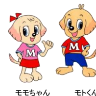
モモちゃん モトくん