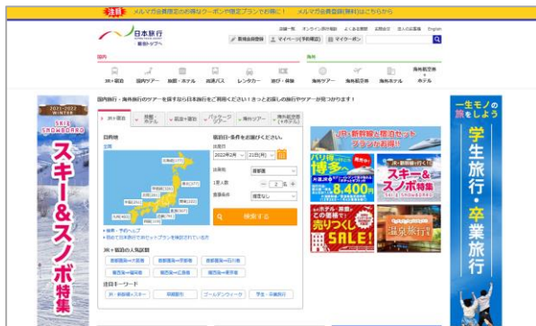
※日本旅行ホームページ(イメージ) https://www.nta.co.jp/