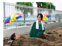
砂むし温泉イメージ