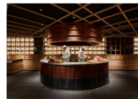
グリル&鉄板焼コーナー