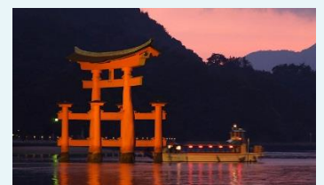
※宮島参拝遊覧船の定期観光船となります