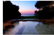
露天風呂イメージ