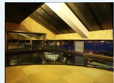
浦島の湯イメージ