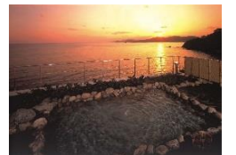
露天風呂イメージ