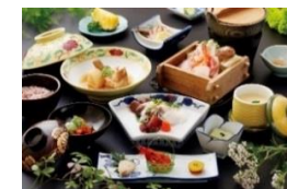
黒豚会席イメージ