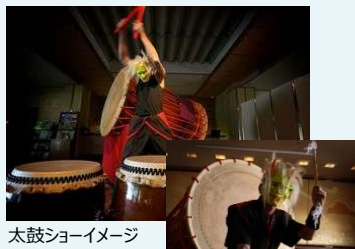
太鼓ショーイメージ